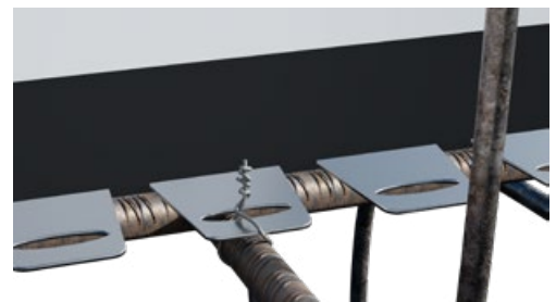
Schnelles & einfaches Anrödeln an der Bewehrung