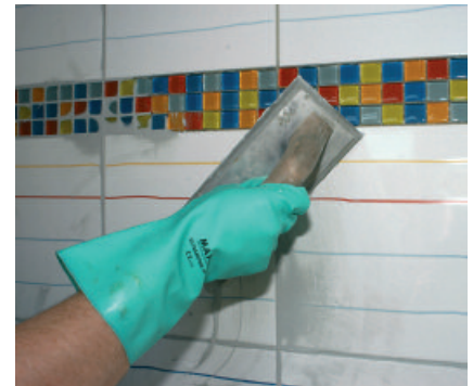
Komfortables, temperaturunabhängiges Verarbeitungsprofil – PCI Nanofug lässt sich geschmeidig leicht in die Fuge einarbeiten.

an Fassaden. In öffentlichen und gewerblichen Bereichen mit starker Nassbeanspruchung, z. B. Duschanlagen, Saunen, Toilettenanlagen. In Verkaufs- und Präsentationsflächen. ■ Auf Heizestrichen, Trockenestrichen, Betonfertigteilen, Gipskartonplatten, Gipsdielen, Holzspanplatten, Holzdielenböden und in Bereichen mit starken Temperaturschwankungen.